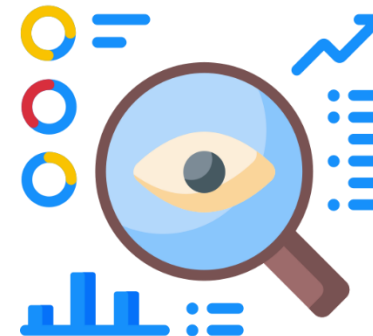
การสังเกต