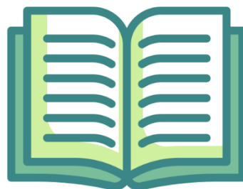
การทบทวนเอกสาร