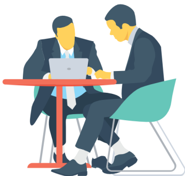
การสัมภาษณ์

เมื่อได้กรอบของปัญหาแล้ว เราต้องกำหนดประเด็นในการรวบรวมข้อมูล ซึ่งวิธีการรวบรวมข้อมูล มีหลายวิธี เช่น