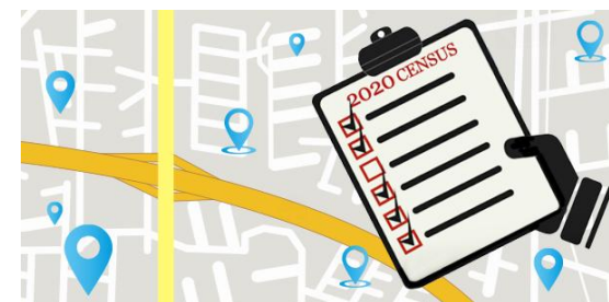
การสำมะโน