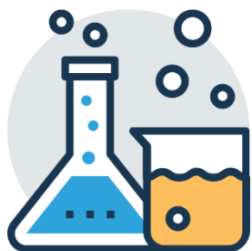
การทดลอง